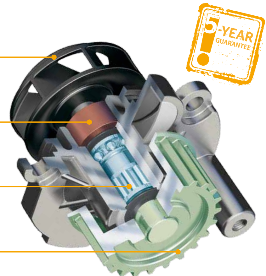
Ozubený kotouč s precizně vytvarovaným profilem zubů